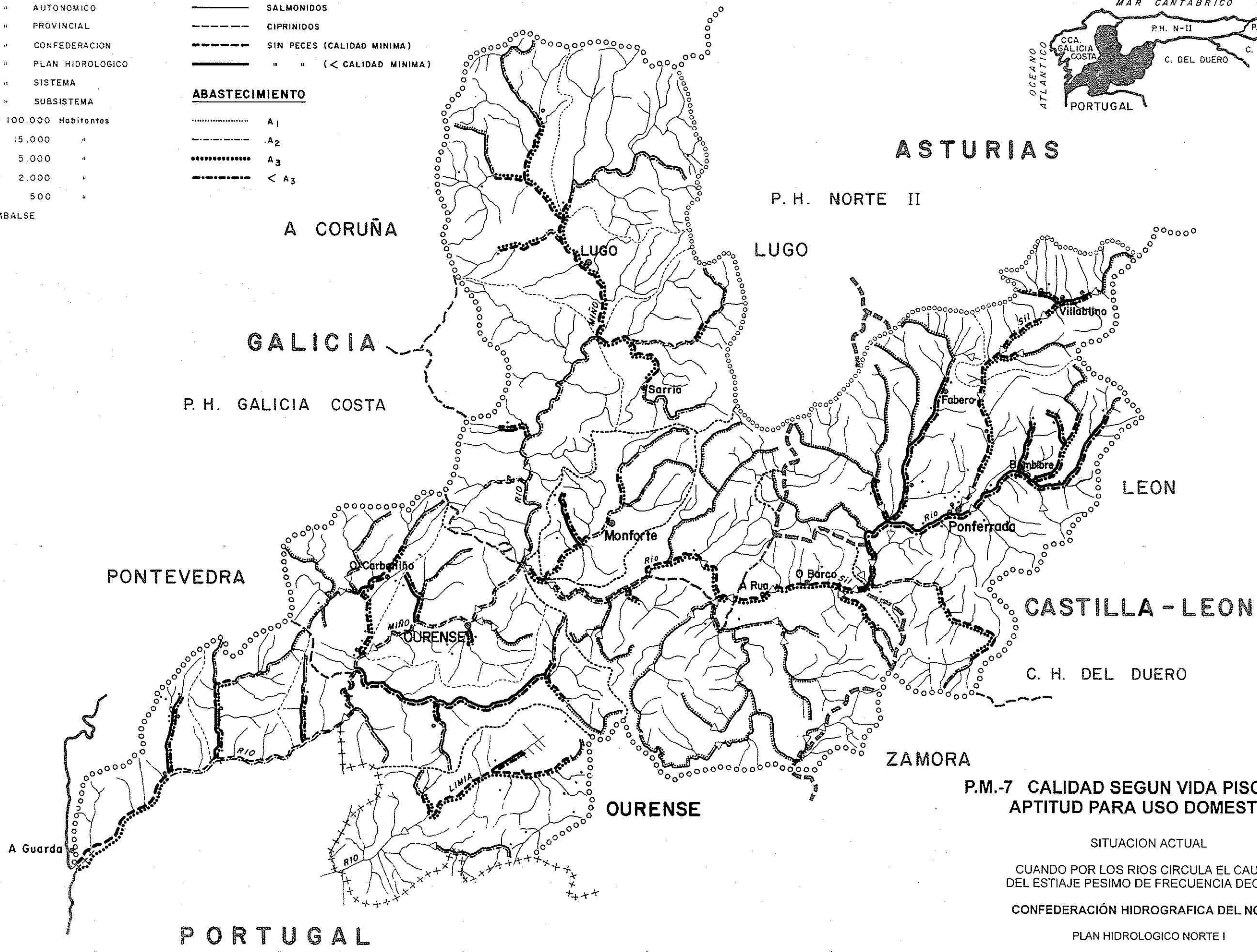
P.M.-7 CALIDAD SEGUN VIDA PISCICOLA Y APTITUD PARA USO DOMESTICO

SITUACION ACTUAL CUANDO POR LOS RIOS CIRCULA EL CAUDAL DEL ESTIAJE PESIMO DE FRECUENCIA DECENAL CONFEDERACIÓN HIDROGRAFICA DEL NORTE