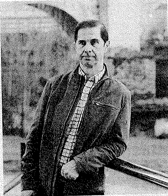
El presidente de la Confederación, Francisco Marín.

Es bueno detectar los problemas e iniciar caminos para cambiar las prácticas. Concretamente, en el Barbaña tenemos prevista una actuación para 2014 y 2015 y la ejecución de un pozo de tormenta en Ponte Noalla. Es una intervención de cara al 2015 porque requiere fondos europeos. En cuanto al río Limia, trabajamos en un programa de investigación y desarrollo pa-